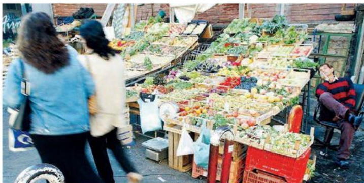
Anche la spesa diventa un problema. Non sono pochi quanti non riescono ad acquistare pure i beni primari